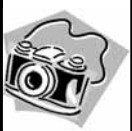
شریف در قاب